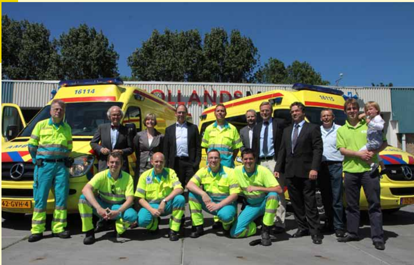
CDA-fractie bezoekt standplaats Gouda