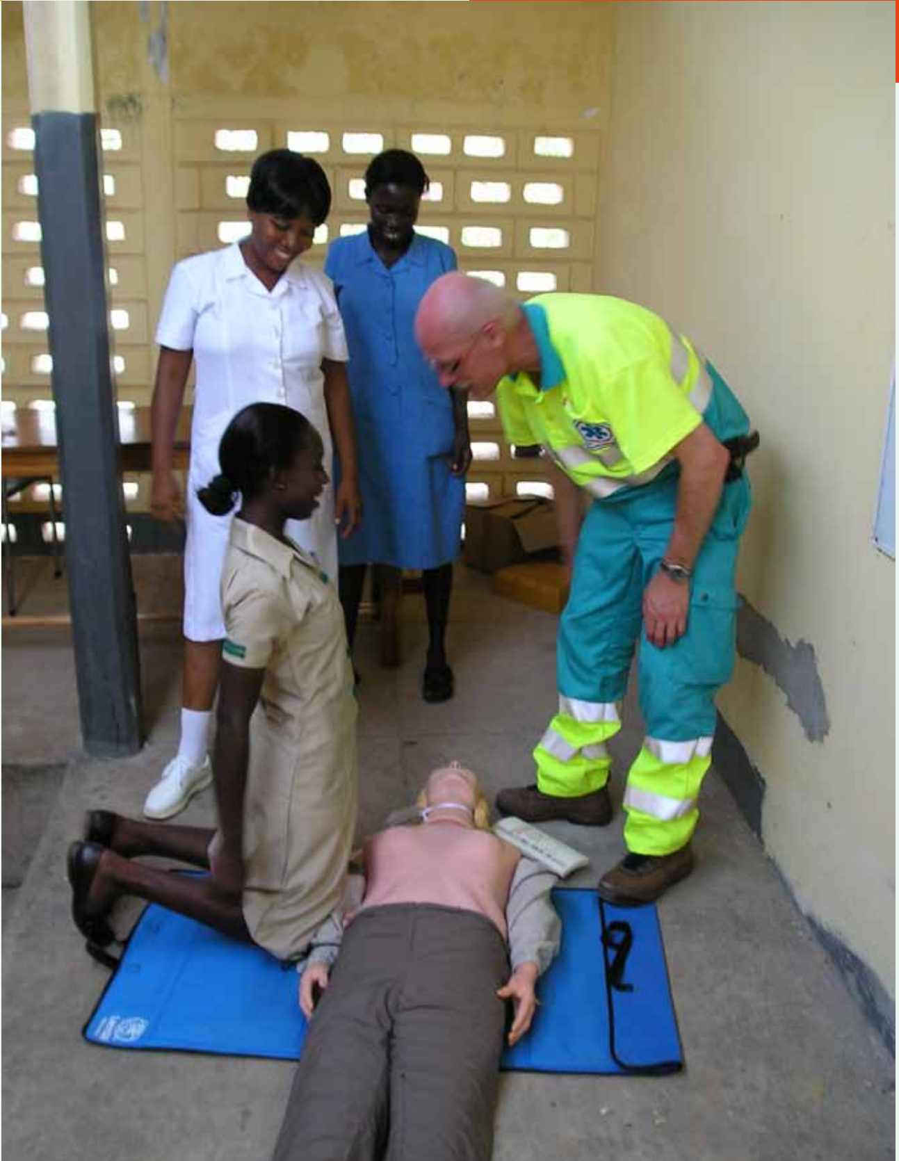
Reanimatietraining Elmina Ghana