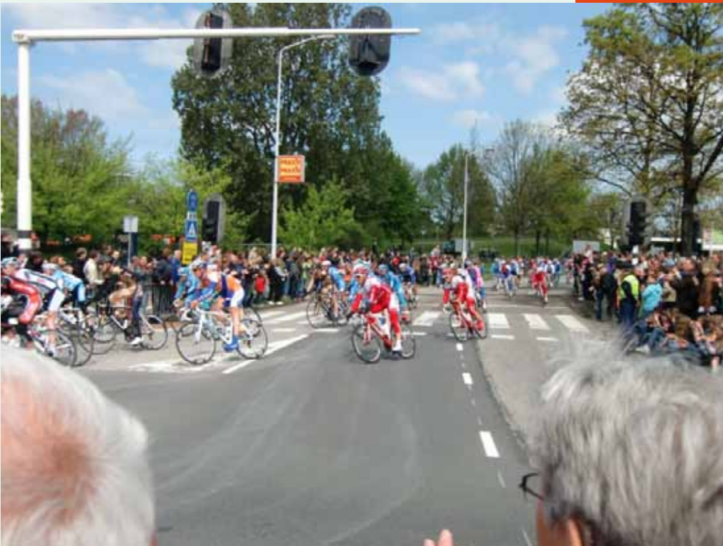
Foto onder: De GIRO d'Italia doorkruist de regio Hollands Midden.