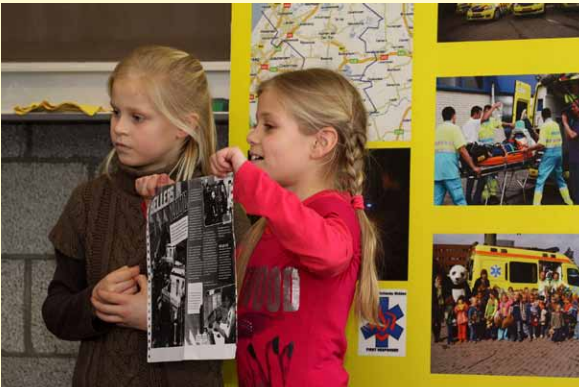
scholenproject is in 2010 afgerond.

Het scholenproject, in het kader van voorlichting over ambulancezorg, werd na twee succesvolle jaren beëindigd in 2010. Veel van de basisscholen in Hollands Midden zijn in die tijd met een bezoek vereerd. Ongeveer 10.000 kinderen op de basisscholen hebben een kijkje kunnen nemen in de speciaal hiervoor ingerichte ambulance. Via de kinderen hebben we meer bekendheid kunnen geven aan de ambulancezorg in het algemeen en onze ambulancedienst in het bijzonder.