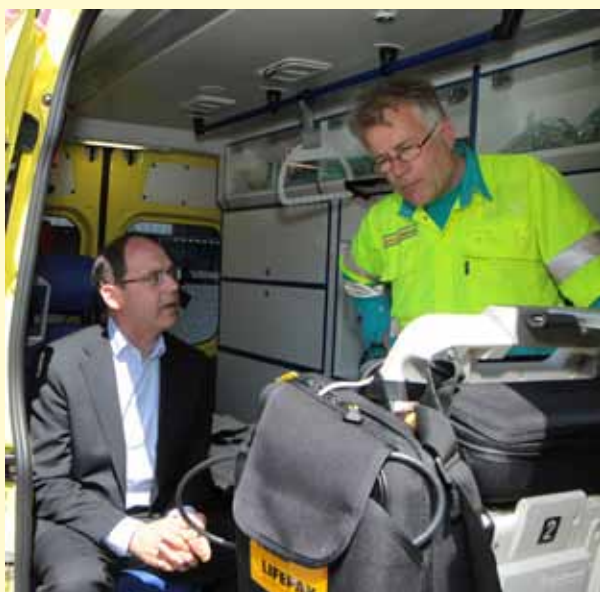
Toenmalig Minister van VWS, dr. Klink krijgt uitleg in de ambulance.

De RAD HM heeft inmiddels de nodige ervaring opgedaan met de Europese aanbesteding van ambulances. In 2010 zijn de voorbereidingen getroffen voor de aanbesteding van 11 ambulances, te leveren in 2011 en 2012. Het eerder gebruikte bestek is als uitgangspunt gekozen. Enkele ergonomische verbeteringen konden hierin weer worden meegenomen.