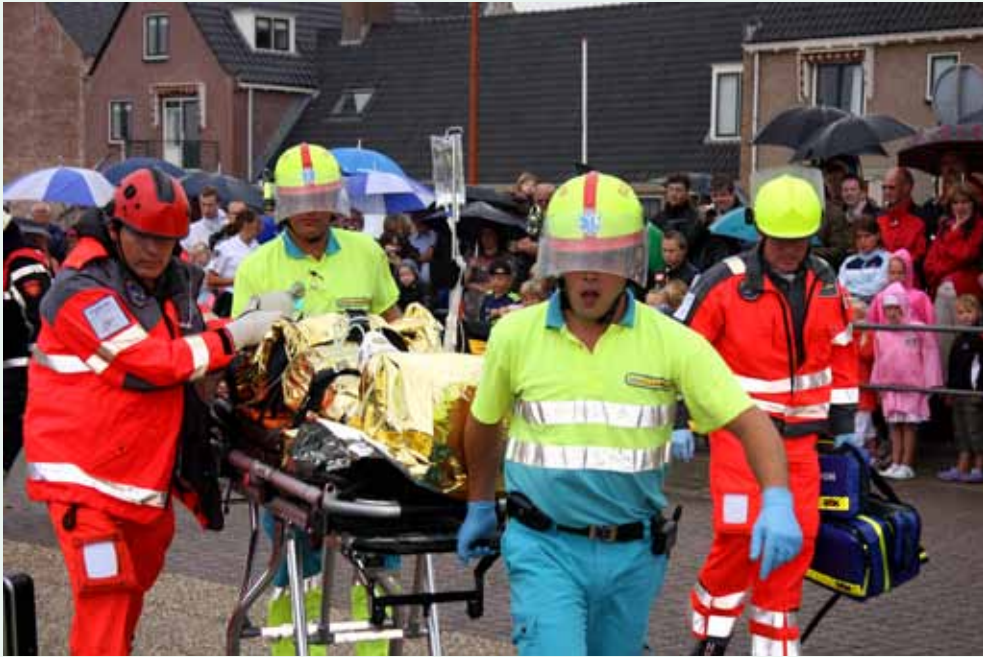
Reddingsdemonstratie in Katwijk.